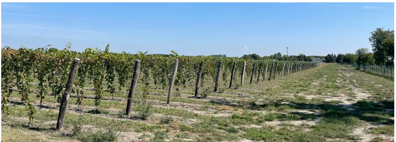
Areal med vinstokke